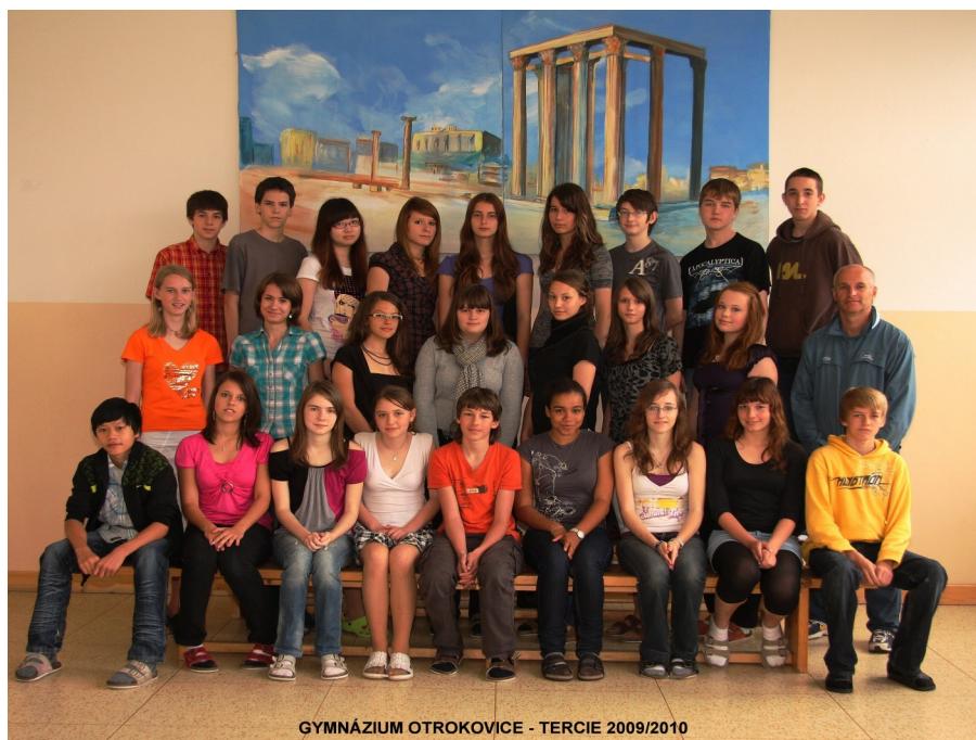
GYMNÁZIUM OTROKOVICE - TERCIE 2009/2010